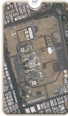
المقر الرئيسي للطالبات