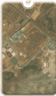
فرع الجامعة بالكامل