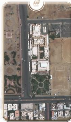
مقر الشرفية - الطب