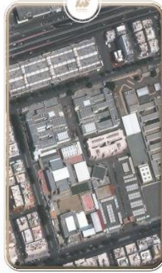
مقر التخصصات الإنسانية