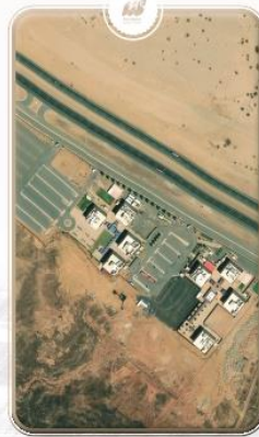
فرع الجامعة بخليص