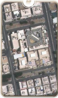
مقر الرحاب - التصاميم