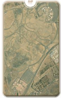
المقر الرئيس للطلاب